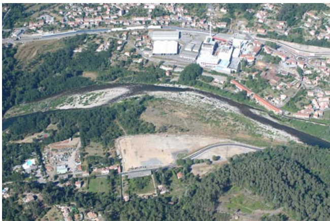
Site de Chamboulas

Cette zone d'activités permet à la communauté de communes d'accueillir plusieurs entreprises (9 lots sur 5,4 hectares) et de répondre à une réelle demande d'installation d'activités industrielles et artisanales.