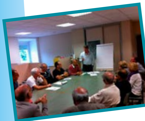
Réunion « sécurité » par quartier