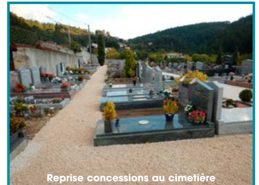
Reprise concessions au cimetière