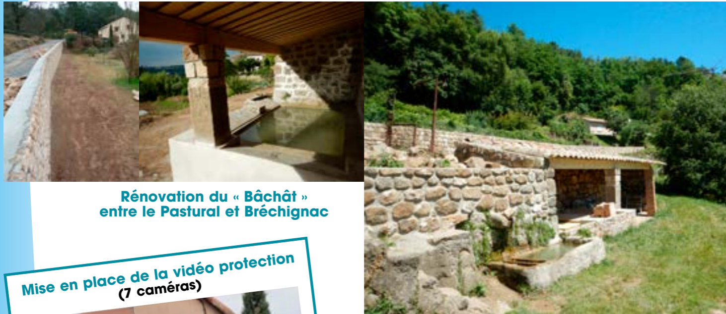
Rénovation du « Bâchât » entre le Pastural et Bréchnac

Création d'une voie verte, avec la Communauté de Communes du Bassin d'Aubenas, le long des berges de l'Ardèche entre l'Espace Deydier et la limite de la commune de Saint Privat