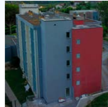
Construction d'un ascenseur côté nord