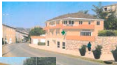
Regroupement de commerces