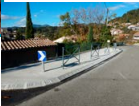
Route du Mas