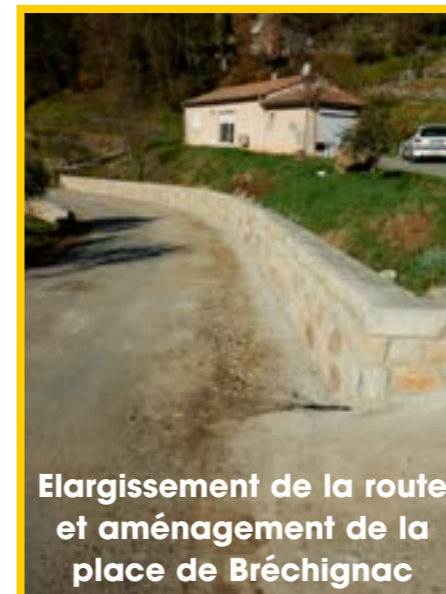
Elargissement de la route et aménagement de la place de Bréchnac