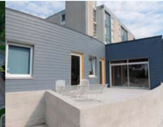
Agrandissement du PASA